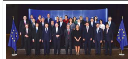
( https://ec.europa.eu ) BIZTOSI TESTÜLET (2014-2019)

Mindenkinek joga van jó minőségű alapszolgáltatásokat igénybe venni, ideértve a vízellátást, a szennyvízelvezetést, az energiaellátást, valamint a közlekedési, a pénzügyi és a digitális távközlési szolgáltatásokat. Gondoskodni kell a rászorulóknak támogatásáról, hogy igénybe tudják venni ezeket a szolgáltatásokat. ( https://ec.europa.eu/commission/priorities/deeper-and-fairer-economic-and-monetary-union/european-pillar-social-rights/european-pillar-social-rights-20-principles_hu#relatedlinks )