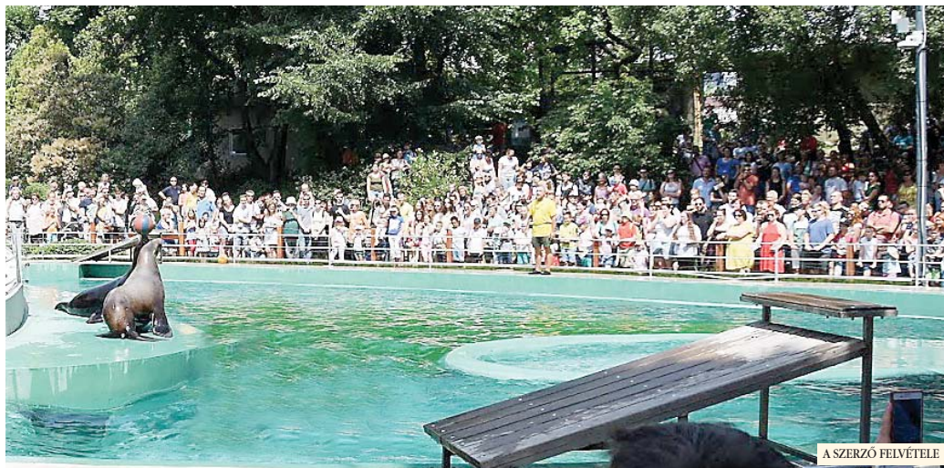
Az Elektromos Szakszervezet legutóbbi, nagy sikerű családi napját az állatkertben tartották meg

Az Elektromos Művek cégcsoport távoli jogelődje 1893-ban kezdte meg a villamos energia üzemszerű szolgáltatását. Az indulás évében 1700 fogyasztási helyet látott el a cég villamos energiával. A munkavállalók hamarosan szakszervezetbe tömörültek. A feljegyzések szerint már 1918-ban a vállalat szakszervezeti beavatkozás eredményeképpen