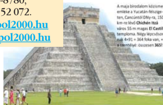
Mexikó: El Castillo temploma