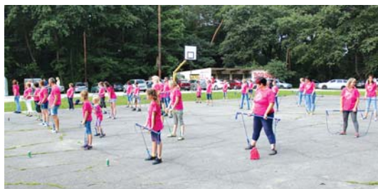
TOVÁBBI KÉPEK: WWW.VD.HU OLDALON A FOTÓ/VIDEÓTÁRBAN

A Csanyik-völgy egy jól megközelíthető helyszín Miskolcon, és tökéletesen