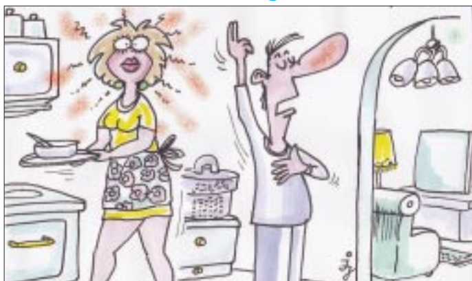
- Lemondok a piáról, a cigiről, a kávéról és rólad, szívem...