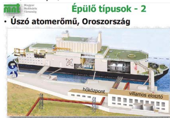
Az orosz úszó atomerőmű elrendezése.

Az előadások prezentációja és videó felvételei elérhetők a társulat honlapján: www.enpol2000.hu