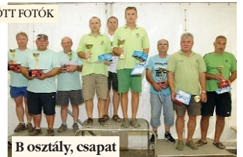
B osztály, csapat