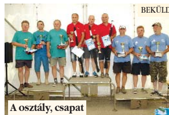
A osztály, csapat