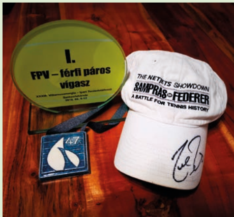
Vitorlás bronz, tenisz vigaszdíj és a „szent ereklye”